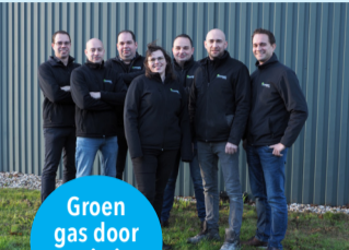
Groen gas door vergisting

Wij laten je het hele proces van inzaai tot oogsten van graszoden zien. Je kunt de machines bewonderen die hiervoor gebruikt worden en je leert meer over het verschil tussen een graszode voor in je tuin en graszode voor een voetbalstadion. We hebben een voetbalveldje waar je een balletje kunt trappen op het gras dat ook in het stadion van je favoriete voetbalclub ligt.