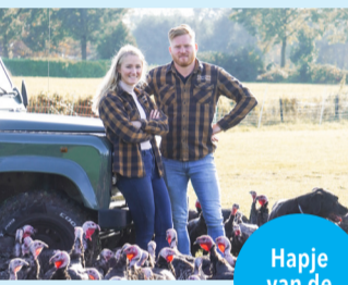
Hapje van de bbq

Samen met onder andere boeren, natuurorganisatie en overheden werken we aan een goed plan voor water. Honderden stuwen in Limburg vertragen de waterafvoer, waardoor water langer wordt vastgehouden en voorkomen wordt dat het te snel wegstroomt tijdens droge periodes. Daarnaast herstellen wij de natuurlijke loop van beken, waardoor ze meer kronkelen.