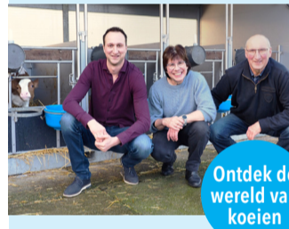
Ontdek de wereld van koeien